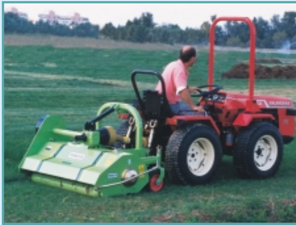
Posteriore - Rear - Arriere - Heck